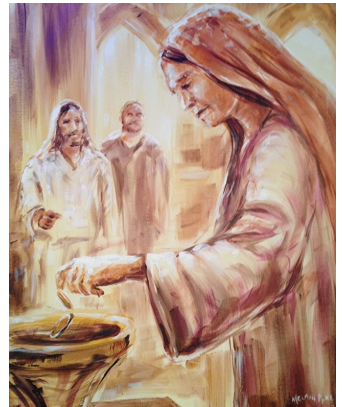
La veuve dans le temple Œuvre de Melani Pyke 21 ème siècle, Canada